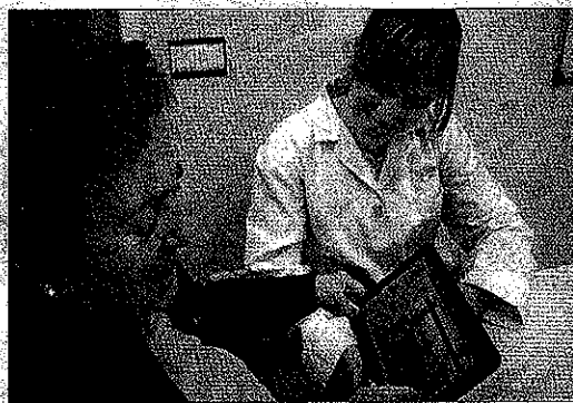
Una mujer accede a los contenidos de la aplicación.

La facilidad y sencillez en el uso son otras de sus ventajas. La pantalla de bienvenida presenta un con-